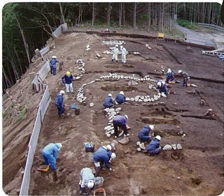
古墳時代初め頃の墳墓 いわいがきかみがほら (石井垣上河原遺跡・大山町)