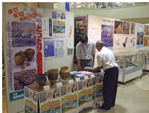
【展示資料の見学の様子】 (パープルタウン・倉吉市)