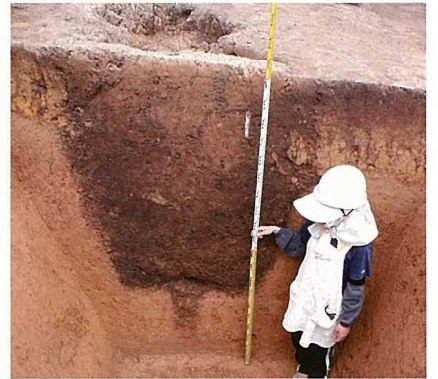
縄文時代の落とし穴

ここでは、平安時代の製鉄場だけではなく、縄文時代の建物跡、集石土抗、落とし穴が見つかりました。また、縄文時代の中頃(約5,000年前)の縄文土器も多量に出土しています。