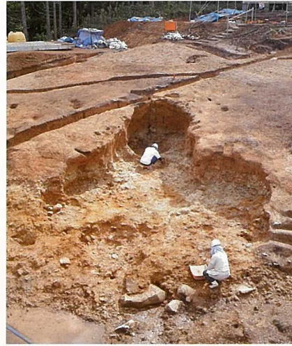
粘土を採掘した穴

平安時代(10~12世紀)の製鉄炉や炭窯が見つかりました。また、製鉄炉を造るための粘土を採掘した穴や作業道も確認され、当時の製鉄場の様子が分かりました。