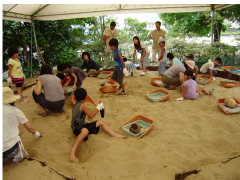
【発掘体験コーナー】