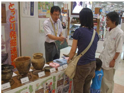
【出土品のタッチングの様子】 (イオン鳥取北店・鳥取市)