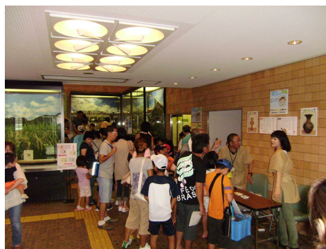
【大盛況のコーナー】