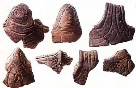
出土した縄文土器