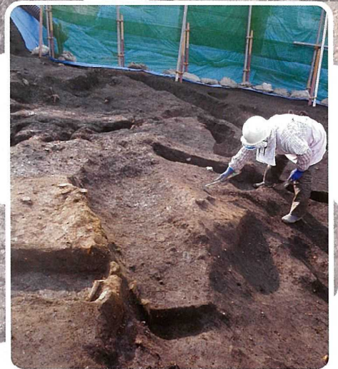
平安時代の製鉄炉跡 あかさかこまるやま (赤坂小丸山遺跡・大山町)