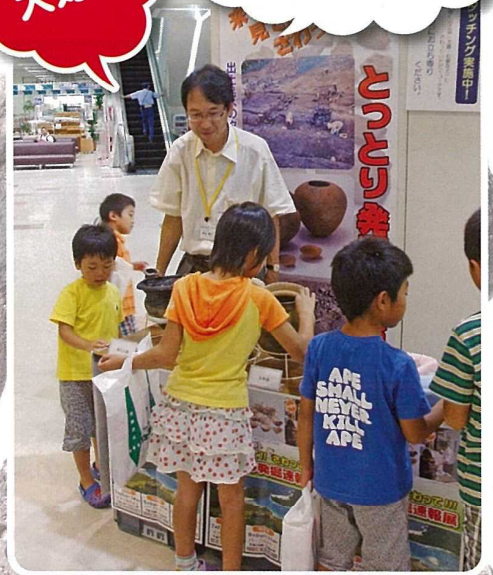
出土品のタッチングコーナー