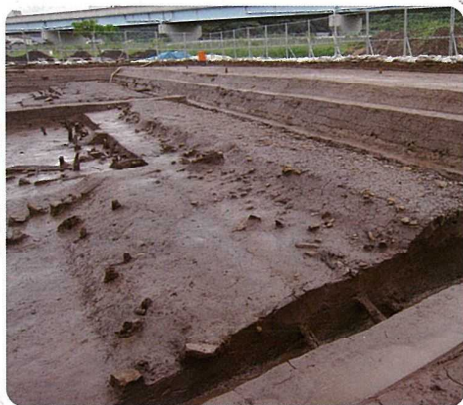
古代山陰道と考えられる道路遺構 あおやかみじち (国史跡青谷上寺地遺跡・鳥取市)