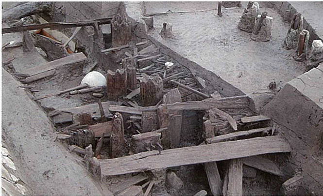
弥生時代の終わり頃の溝