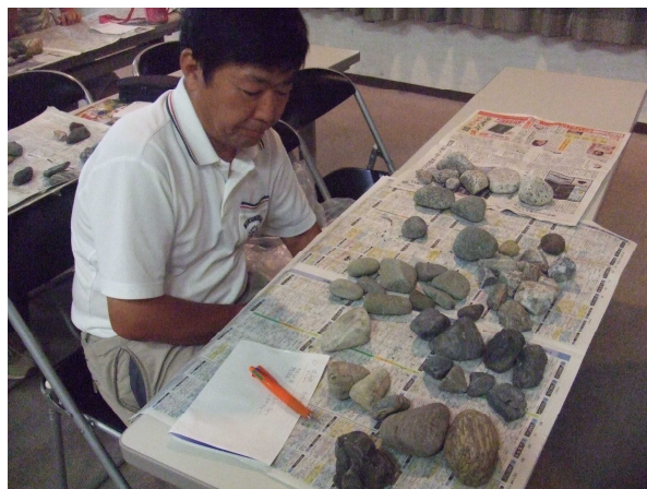
「石ころ図鑑作成（海岸編）」