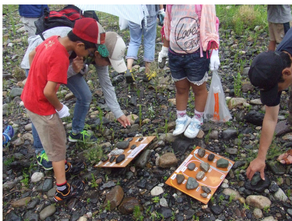
「石ころ図鑑作成（川原編）」