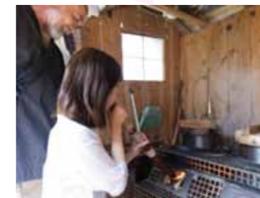
昔ながらのカマドでご飯炊き体験