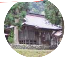
福姫伝説の樂樂福神社