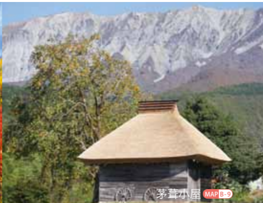
茅葺小屋 MAP B-9

日本の原風景が残り、写真家に好評な江府町内でも有数の三景です。秀峰大山の南壁とブナ林を望む「鍵掛峠」は日本有数の紅葉スポット。巨木と沢、苔むす岩が幽玄の世界を感じさせる「木谷沢溪流」は大手飲料メーカーのCMにも起用された場所。背後に大山を望む昔懐かしい「茅葺小屋」はどうしても写真に収めたい絵になる被写体です。