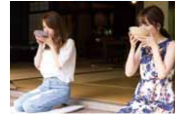
ゆったりと縁側 カフェタイム

身体に優しい身土不二(しんどふじ)の野菜や、手打ち十割の蕎麦でデトックスし、ヒメボタルとゲンジボタル、星空の織り成す幻想の世界に遊べば、日頃の慌ただしさから心が解き放たれ心身ともにリフレッシュできます。