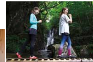
縁結びロードを通ると恋愛運も上がるかも？