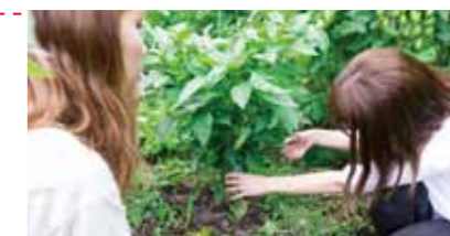
みずみずしい朝採れ野菜の収穫体験