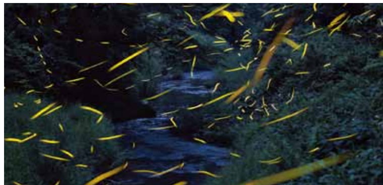
ふくまき 日南町 福万来ホタル乃国 MAP F-4

ありふれた山中の舗装道路からふらりと林に入ると、そこには林一面を金色に埋め尽くす数万の神秘的なヒメボタルが輝いています。見あげれば高く舞うゲンジボタル、さらにその上には満天の夏の星空。森に棲む小さなヒメボタルと、小川に棲むゲンジボタルが同時に見られるのは日本国内でも非常に稀な光景で、星空とあわせて奇跡的ともいえる光のハーモニーを奏でています。日々の暮らしでは決して味わうことのできない贅沢と感動を是非ご堪能ください。