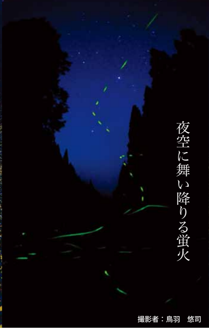
夜空に舞い降りる蛍火