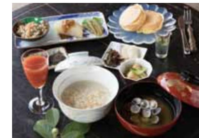
薬膳料理で体の中までリフレッシュ