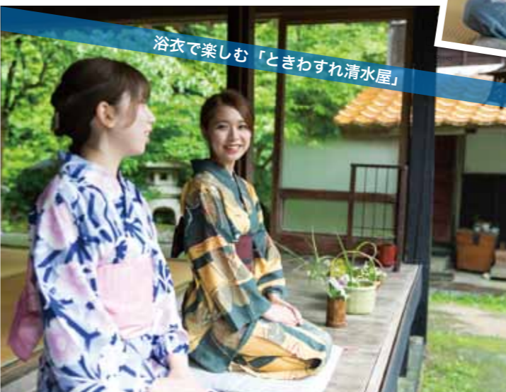
浴衣で楽しむ「ときわすれ清水屋」

期間：6月20日頃～7月15日頃 場所：鳥取県日野郡日南町菅沢1019 催行人数：最少2名、最大7名(受入は1日1グループ平日のみ) 料金：お一人様16,000円～(税別)(1泊2食付き) ※要予約(3日前まで) ※お姫様グッズのお土産プレゼント お問合せ：ときわすれ清水屋 0859-87-0006 手数料：10% ホームページ：https://www.nichinan-trip.jp/stay_experience/shimizuya/