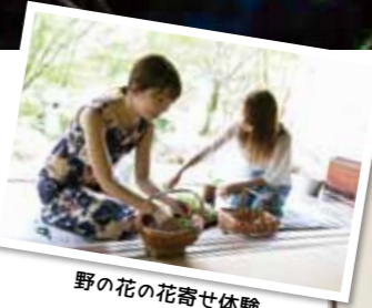
野の花の花寄せ体験