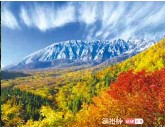
鍵掛峠 MAP B-9