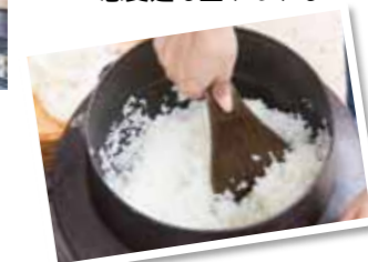
香ばしくふっくらとしたカマド炊き飯の出来上がり♪