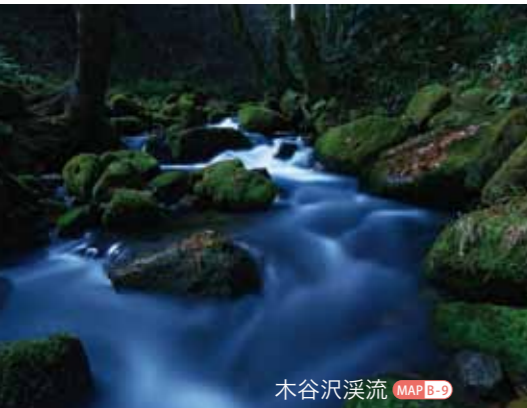
木谷沢溪流 MAP B-9