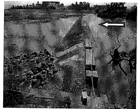
取水制限前(5/15)の状況