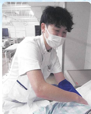
70期生（社会人入学生）

社会人入学でしばらく勉強から離れていたもので、勉強面や学校生活面でかなり不安を感じていました。実際の授業では難しいところもあつたりしますが、先生方からの温かいサポートや質問しやすい雰囲気などもあり学びやすい環境となっています。