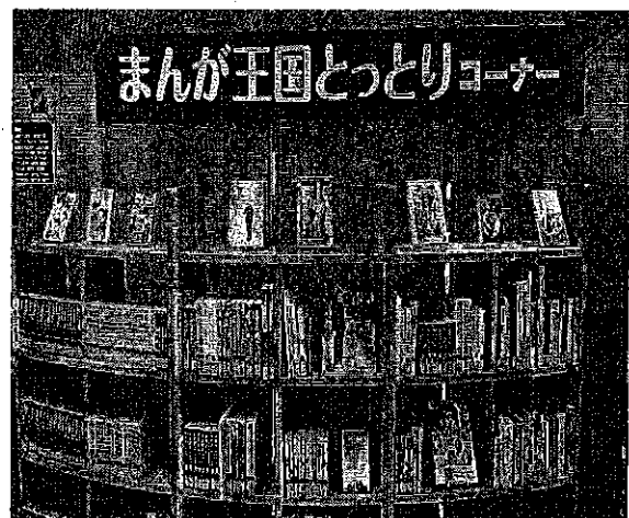
まんが王国とっとりコーナー