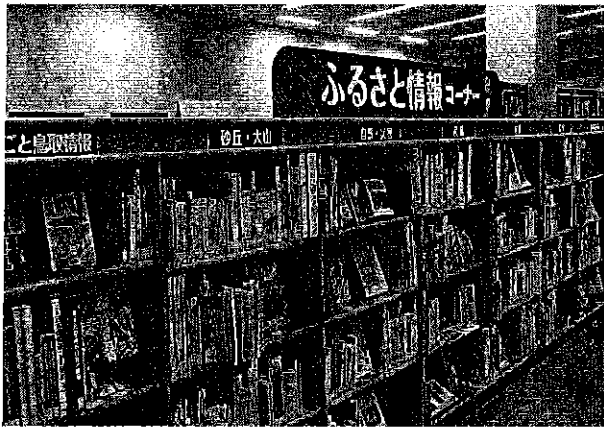
ふるさと情報コーナー