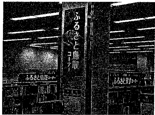
ふるさと鳥取コーナー