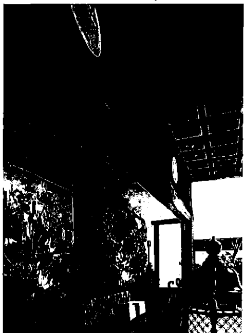
御霊間、高間の格天井