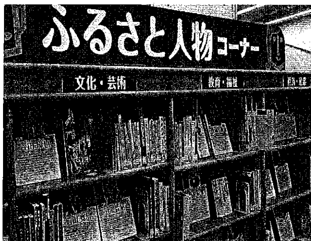
ふるさと人物コーナー