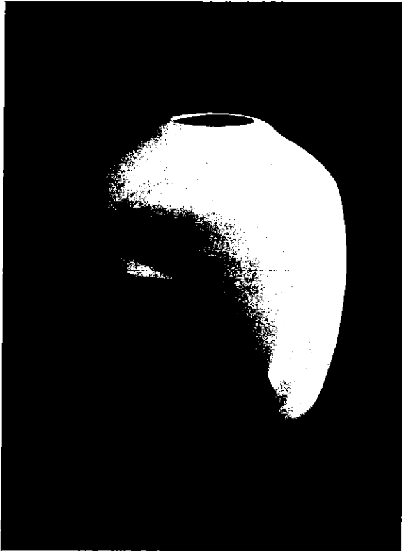
白瓷面取壺 1991 鳥取県立博物館所蔵 第11回日本陶芸展毎日新聞社賞