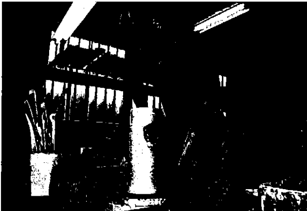
ろくろによる成形