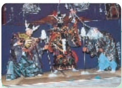
江府町下蚊屋 荒神神楽

「人」のルネッサンス 地域に古くから伝わる「とんどさん」を近所のおじさん、おばさんが教えてくれました。地域の人って、大切な先生なんだね。もつというんな人と接してみたいなあ。