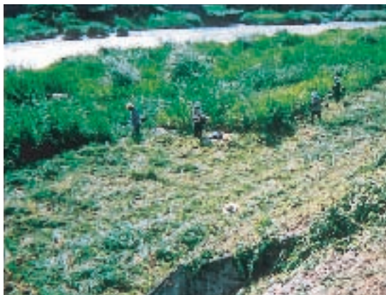
巨石積魚道設置予定箇所