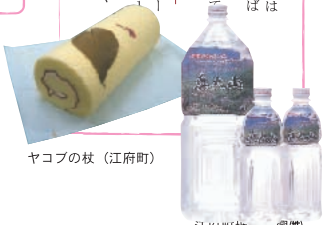
ヤコブの杖（江府町）

「食」のルネッサンス ブナ林から湧き出る「奥大山の水」はのみやすくておいしいと皆さんに嬉ばれています。 関西周辺のスーパーでも販売されていて、売上も毎年増えています。 この前、「ズームイン朝」で桜ローケーキがお取り寄せランキング第一位になってたね。 すごいね。全国で有名なお菓子は、こんな近くで作られているんだね。