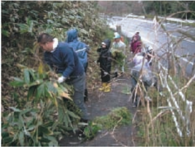
街道の草刈りボランティア

伯耆町間地く日野町舟場間にある出雲街道の「間地峠」には、かつて茶屋があり、街道を往来する旅人の疲れを癒す憩いの場であったと言われています。