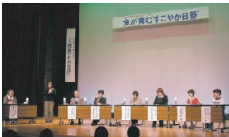
小学生も参加したパネルディスカッション