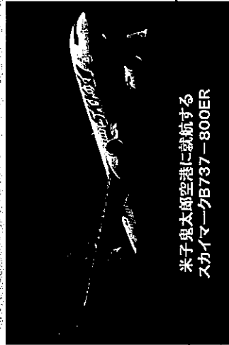
米子鬼太郎空港に就航するスカイマークB737-800ER

これらにより山陰と国内外を結ぶ航空需要が高まり、県内空港を発着する路線の拡充が図られ、旅行、企業活動、相互交流など、さまざまな活動に経済効果が及ぶものと見込まれる。 県では、今後も県内空港の路線の拡充、便数の増などを働きかけ、更なる利便性の向上を目指す。