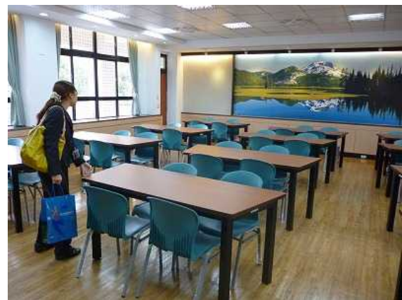
コミュニケーション教室