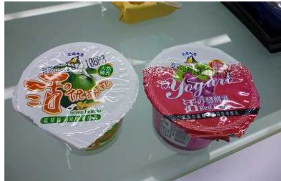
学内の乳製品加工場で作った 柚子と葡萄のヨーグルト