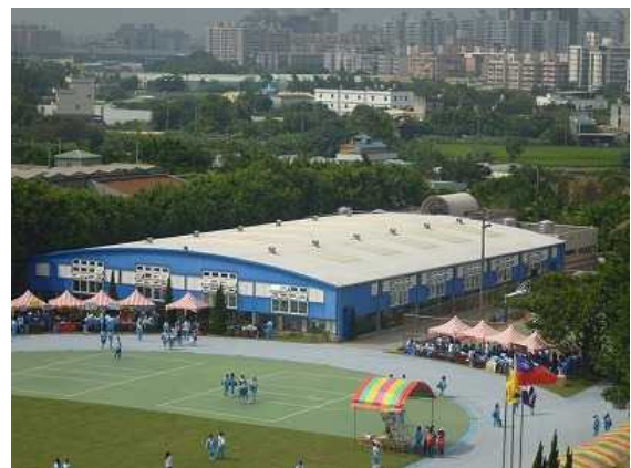
温水プール（写真手前が校旗）