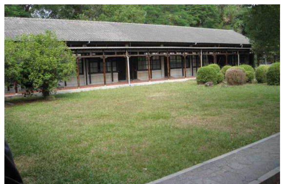
35メートル四方の中庭