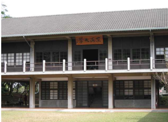
学長室のある建物