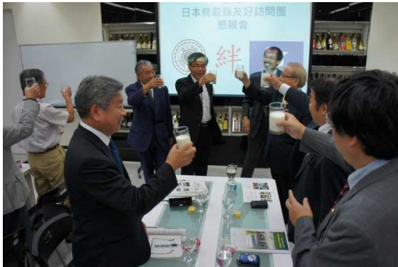
学内の牧場で育てている乳牛から搾ったミルクで乾杯