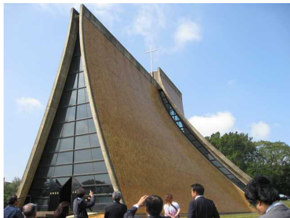
市民の憩いの場にもなっているチャペル