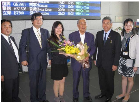
台中市職員の出迎え (台中空港)