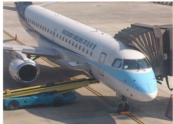
チャーター便 (華信 (マダリン) 航空)