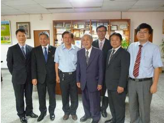
呉理事長（前列左から2人目）を囲んで記念撮影 （後列の方が王区長）