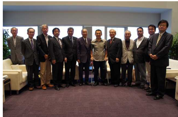
鳥取県日台親善協会とともに 徐副市長（右から6人目）を囲んで記念撮影