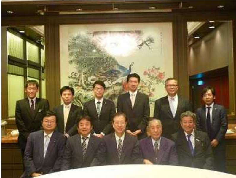
羅秘書長（前列中央）を囲んで記念撮影