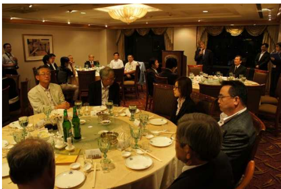
歓迎夕食会の様子

台中市議會主催の歓迎夕食会を開催していただき、鳥取県日台親善協会とともに参加し、意見交換を行った。