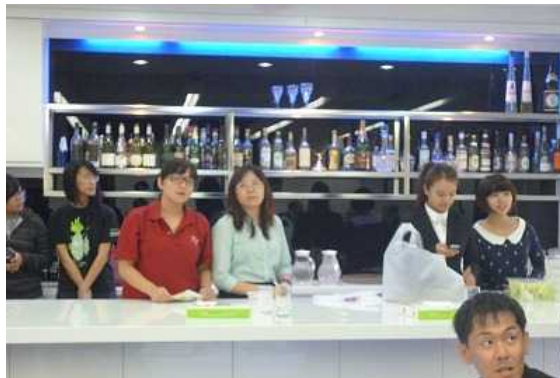
餐旅管理学科の学生