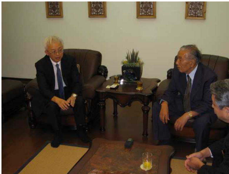
林会長との意見交換