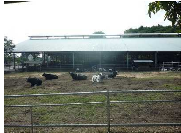
学内で飼育している乳牛