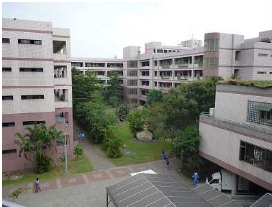
校舎（学内の雰囲気は高校というより、 大学といった感じ）