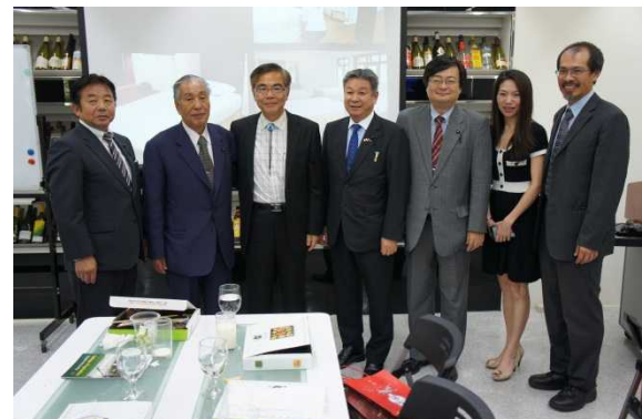
閻農学院長（左から3人目）を囲んで 記念撮影（右端は王教授）