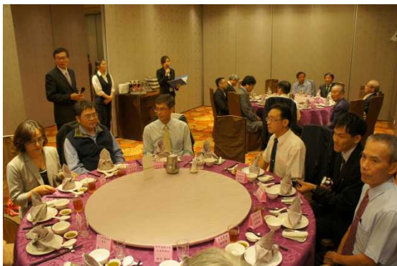
歓迎夕食会の様子

石岡区主催の歓迎夕食会を開催していただき、鳥取県日台親善協会とともに参加し、意見交換を行った。