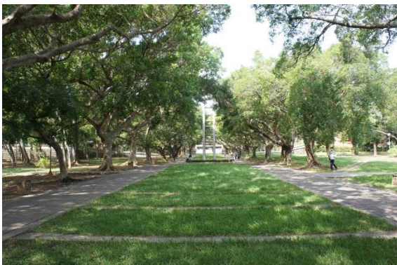
文理太道（緑のトンネル）