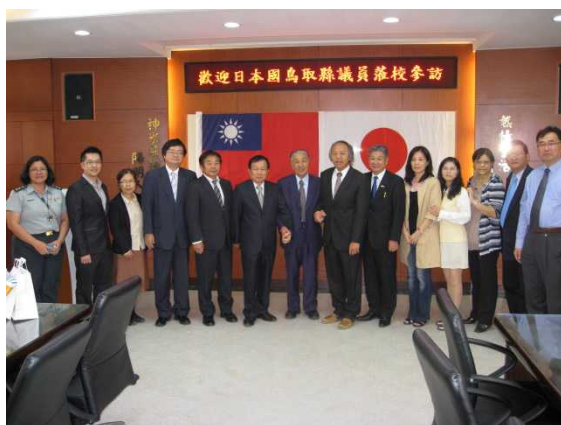
林校長（左から7人目）、何会長（右から6人目）を囲んで記念撮影