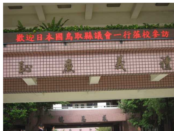
学校正面の電光掲示板