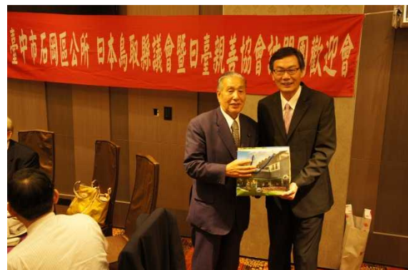
王区長との記念品交換