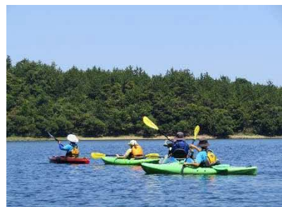
カヤック体験を通して交流

児童相談所が「この子を里親さんにお願いしたい」と考えたとき、子ども・里親さん双方のことを総合的に判断し、子どもにとってどの里親さんにお願いするのが良いのか検討できるよう、普段から里親さんと「顔の見える関係」を目指して業務にあたっています。