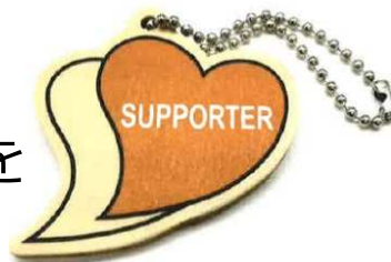
あいサポートキッズストラップ