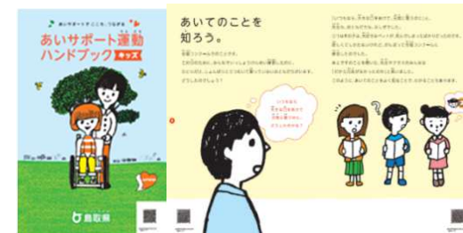
学習用教材 (あいサポート運動 ハンドブック キッズ版)