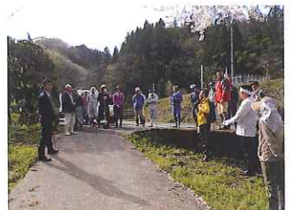
現地に到着。集落の方の指示を受けて、みんなで作業します。