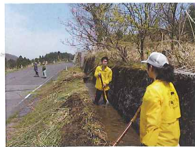
4月の水はまだ冷たい。でも周りに負けないよう力いっぱい泥すくい。