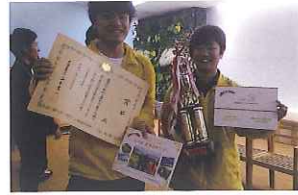
「食と農林漁業大学生アワード」の様子。2016、2017年と出場し、2016年には農林水産大臣賞を受賞。

を形にし、その輪を広げる取り組みを行うことが出来ていたからではないかと思えます。 賞の獲得だけでなく、今日の活動の中でも私たちが集落により近い存在となれている事を実感する機会が増えてきました。自分たちの活動に対する誇りを胸にこれからも鳥取各地を訪れ、共に作業をする仲間として、集落との関わりを深いものにしていければと思っています。これから先、集落が学生の力を必要とする機会は増えていくと考えられます。その中で、私たちは集落と学生をつなぐ「きっぷ」のような役割を果たしていきたいです。