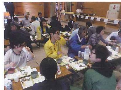
交流会では地元のお母さんたちが作ってくれたお昼ご飯をいただきました。美味しすぎてお代わりいっぱいしちゃう！