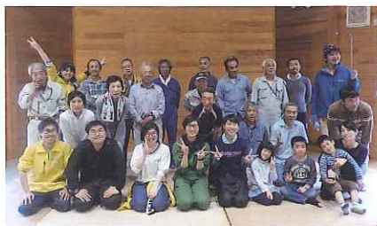
一緒に水路清掃したメンバーでの集合写真。また次のボランティアにも参加したいな！