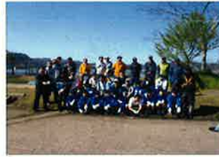
○春の健康散策ウォーキング(5月12日)