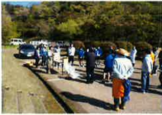
○春のメダカボランティア(4月20日)