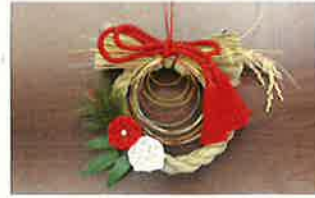
○フラワーアレンジメント教室(12月22日)