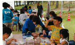
○おさかな教室(7月20日)