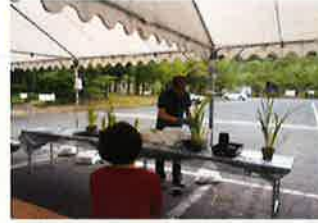
○夏休み親子おもしろ教室(7月28日)