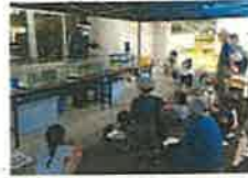
○OSDGsクリーンウォーク大会(10月24日)