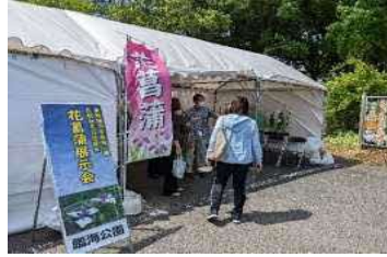
○花しょうぶ展示会