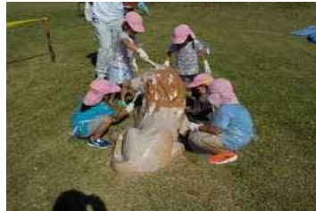
○きりん公園動物遊具お色直し