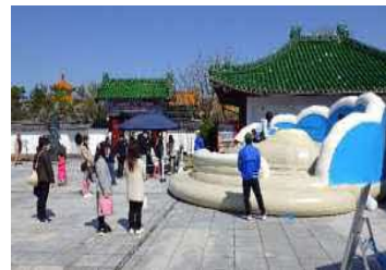
○春の子どもまつり