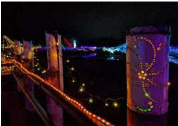
○あやめ池ウインターイルミネーション