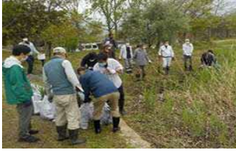
○メダカボランティア