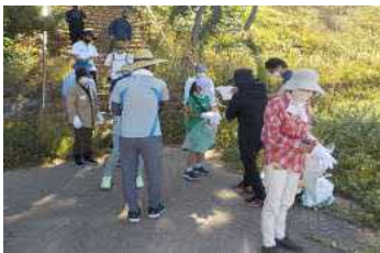
○SDGsクリーンウォーク