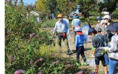
○蝶の観察とミニバタフライガーデンづくり