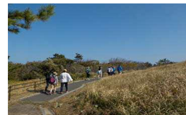
○シーサイドマラニック