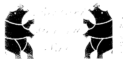
デザイン展（現在制作中）

色々な“当たり前”が変わる現代社会に生きるからこそ、アートを通して自らの感性を磨き、豊かさや美しさの尺度を自分なりにもつことが重要だと考えています。様々なアーティストが滞在することのプロジェクトを通し、一人でも多くの人に素晴らしい出会いがあることを願っています。