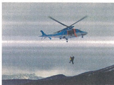
(航空機、航空レンジャーによる吊り上げ救助訓練)