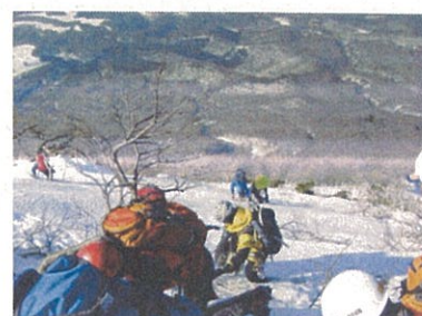
(救助活動中の訓練員)