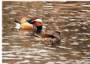
美しく平和な姿をした鳥で、一年中県内の沼や池に生息している水鳥