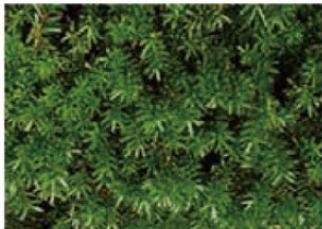
国の特別天然記念物にも指定されているイチイ科の針葉樹で、大山に大群落を形成