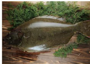
砂丘海域が広がる本県沿岸部に多く生息。刺身や寿司ネタに用いられる高級食材