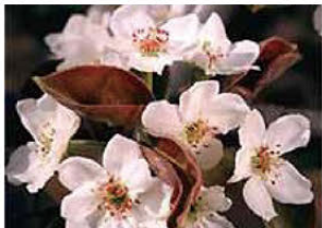
鳥取県の産業・生活などとの関係が深く、県民に広く愛され親しまれている花