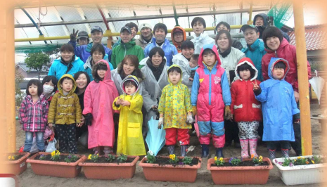
「参加者全員 で記念撮影」