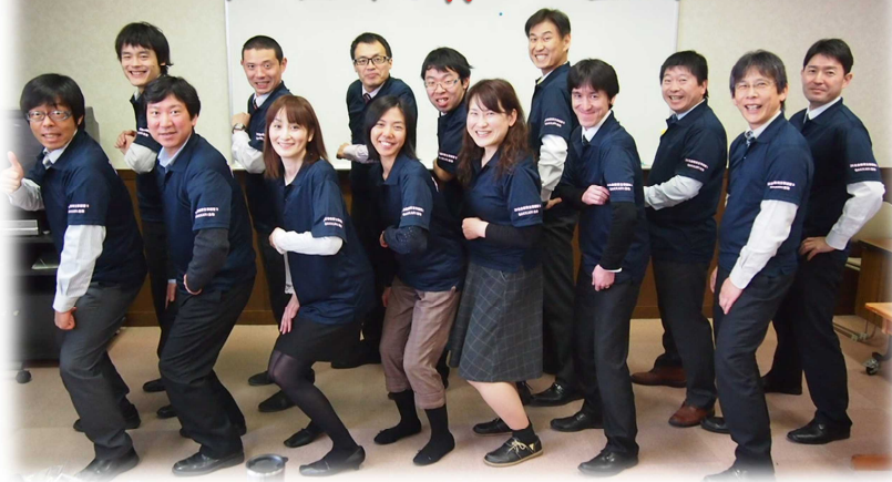
受講生作製のポロシャツで、はいチーズ！