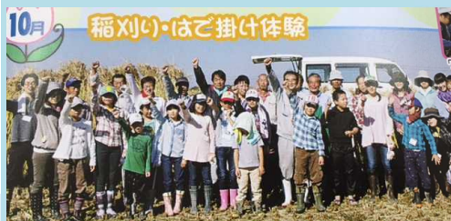
10月 稲刈り・はご掛け体験

食べ物に興味を示すようになり、育てて収穫した野菜が食卓に出ると「これって・・・」と実のなり方や匂などを言うようになりました。人生初の稲刈りを喜んでいました。