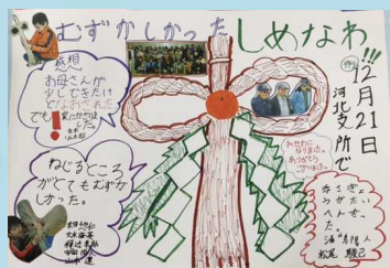
「子どもたちの壁新聞」