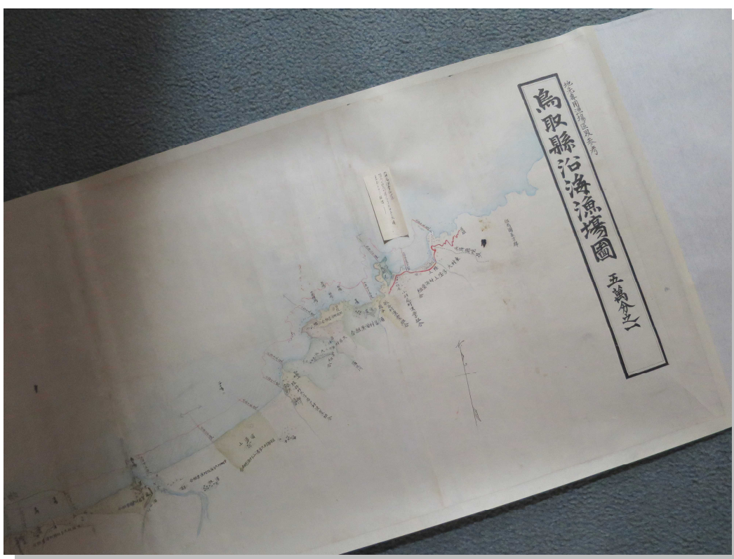
修復を施した漁場図