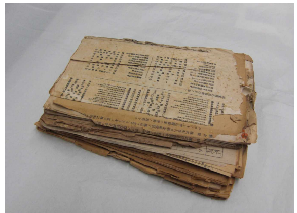
酸性劣化した簿冊

当館では、原本保存が必要とされる歴史的価値、劣化の度合い、利用頻度等を勘案して、年次計画で専門業者による補修を行っています。とりわけ当館が所蔵する公文書は、書籍類と違って1点しか存在しません。鳥取県政の根拠ともいえるべき記録類を残していくことは、当館の責務といえます。