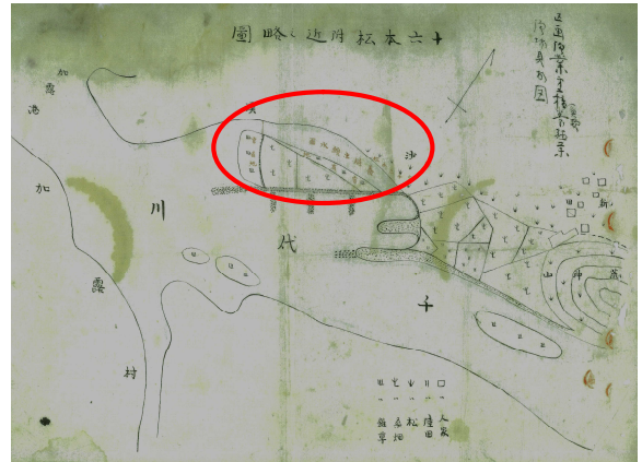
「区画漁業第二種魚類養殖業漁場見取図」

しかし、平成17年に公文書館が確認した際には、破損が進み触れることも出来ない状態になっていました。同家の蔵で発生した雨漏りが原因と考えられます。後世に伝えるべき文書であっても、復元精度とコスト面を考えると、すべての文書を救済するのは困難となります。