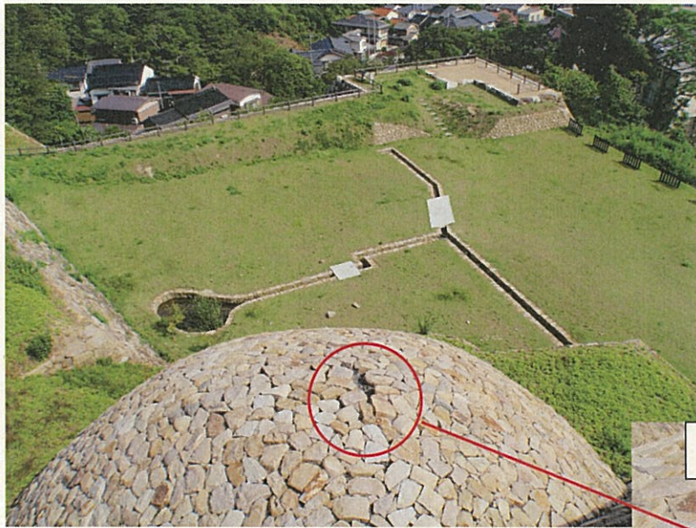
毀損箇所 1 (遠景)