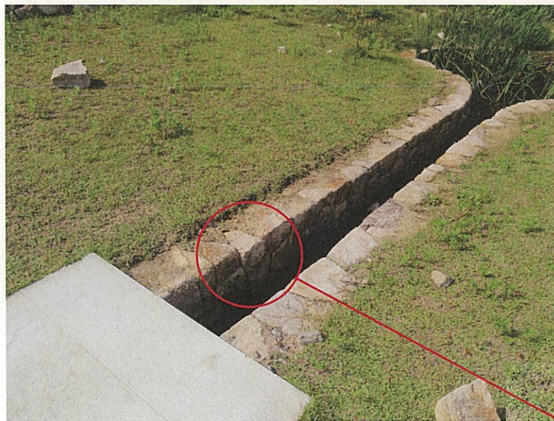
毀損箇所 2 (遠景)