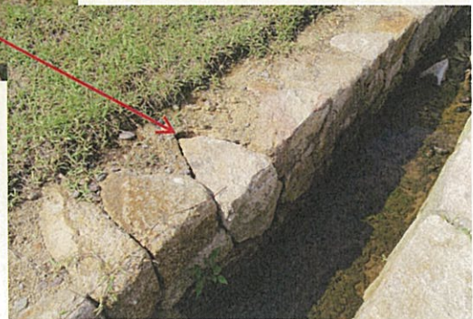
毀損箇所 2 (近景)