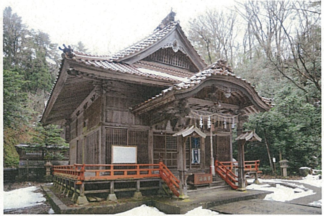
立川稲荷神社 拝殿及び幣殿