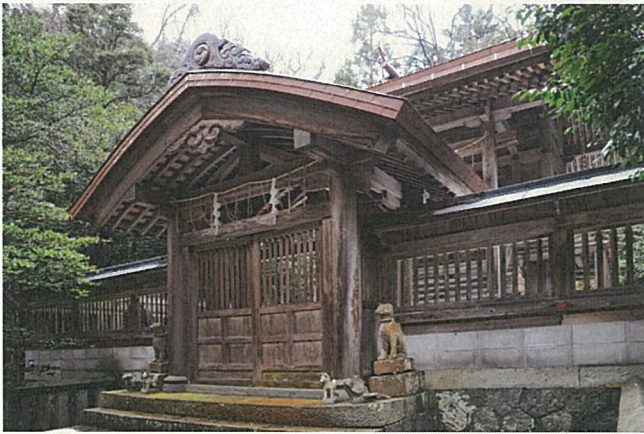
立川稲荷神社 中門