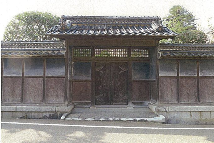
米原家住宅 上門及びび