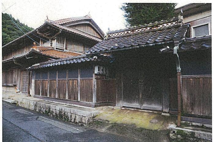
米原家住宅 下門及びび