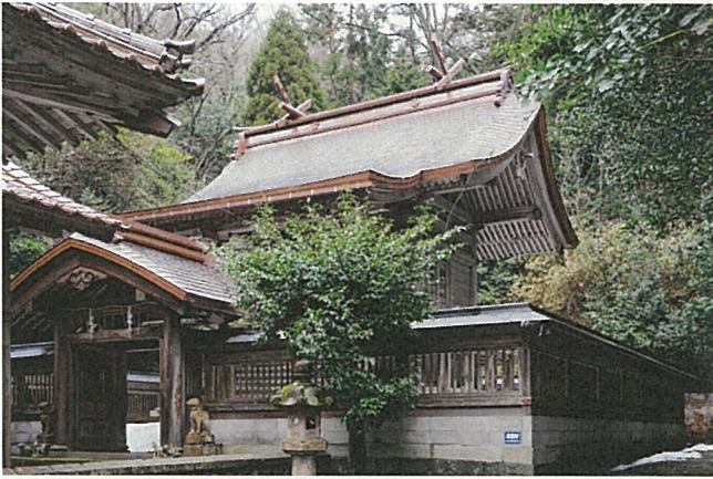
立川稲荷神社 本殿