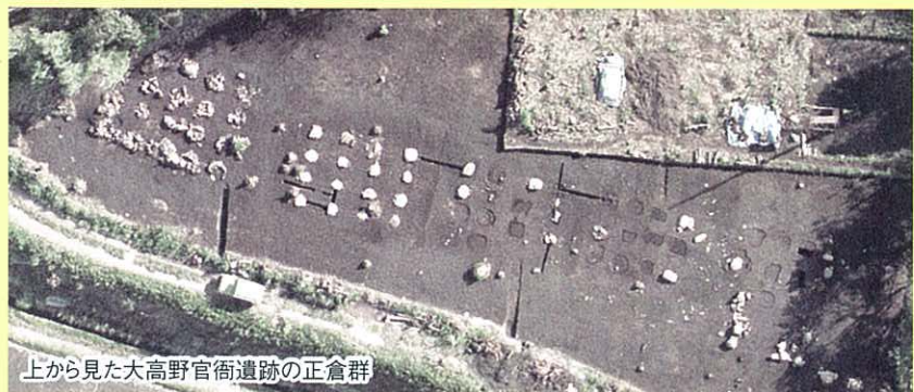
上から見た大高野官衙遺跡の正倉群