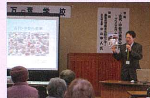
※写真は昨年度国府町で開催した様子

埋蔵文化財センターでは、鳥取県の考古学について広く情報発信するため、職員(文化財主事)が各地に出向き、「出前講演」を行っています。講演の実施にあたっては、講師への謝金は不要です。(旅費についてはご相談ください。)会場については御準備ください(会場使用料等の経費は申込者負担でお願いします)。