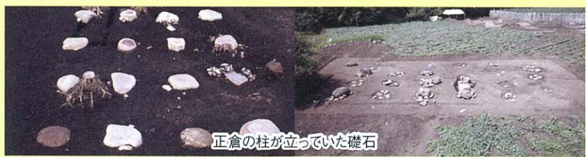
正倉の柱が立っていた礎石