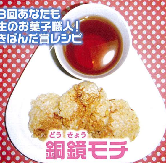
どうきょう 銅鏡モチ