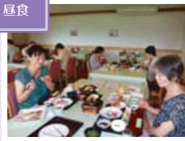
休暇村奥大山で白いかメインの豪華昼食に舌鼓