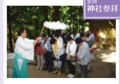
金持神社でのお祓い