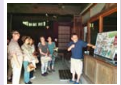
大近藤家特別公開