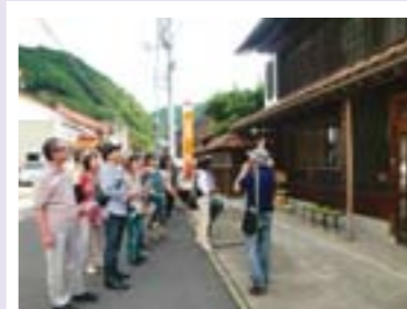
ガイドと一緒に根雨のまち歩き