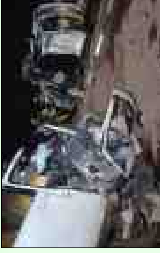
平成22年2月14日、米子自動車道(伯耆町金屋谷) で発生した正面衝突事故で、大学生3名が死亡。

高速道路本来の定時性・安全性の確保を図るため、『米子自動車道(蒜山IC～米子IC)』 及び「米子道路」について4車線化を行うこと。 また、「米子道路」については、当面の対策として、早期に付加追越車線を供用すること。