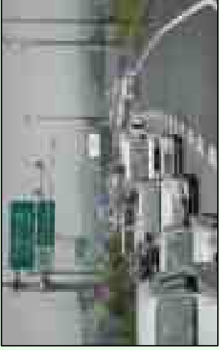
米子道路では、交通量の増加により 通勤時間帯を中心に交通渋滞が発生