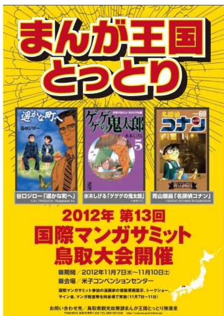
（2012年国際マンガサミット決定）