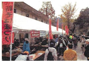
日野郡新そばまつり(日野町)