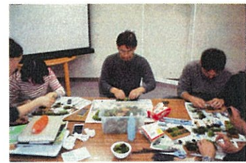
小さなイベント・コケみつけ(江府町)