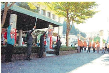
日野軍★秋の陣オープニングセレモニー 生きいきひのふれあいまつり内(日野町)

○今回の取組を通じて地域の活動団体の間に相互理解と連携の機運が高まってきたことから、今後のイベント等の共同情報発信活動は住民主導の取組として継続できるよう支援を行いたい。また、「小さなイベント」の造成、運営を通じて日野郡内における地域資源の活用と地域間交流の拡大を図ることを目的として、熱意のある住民団体を対象に「小さなイベントの企画力、情報発信力の向上」、「個性的なイベントに絞り込んだ情報発信」について重点的な支援を行って地域の底上げを図りたい。