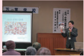
※写真は昨年年度府町で開催した様子

埋蔵文化財センターでは、鳥取県の考古学について広く情報発信するため、職員(文化財主事)が各地に出向き、「出前講演」を行っています。講演の実施にあたっては、講師への謝金は不要です。(旅費についてはご相談ください。)会場については御準備ください(会場使用料等の経費は申込者負担をお願いします)。各種研修会や地域の歴史学習会等でご活用ください。