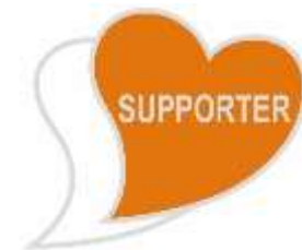
あいサポートバッジ

バッジのデザインは、障がいのある方を支える「心」を2つのハートを重ねることで表現しています。