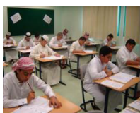
1 週間の授業時間数