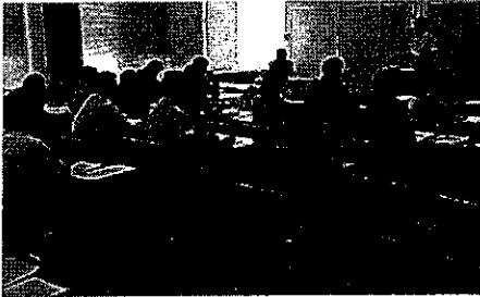
営業ポイントの講義