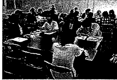
講師による個別の助言