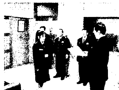
【感謝状の贈呈状況】