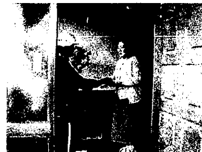
【訪問時の声掛け状況】