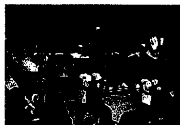
けいさつ春祭りの状況